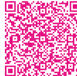
4 Auto JCVP denegando 5