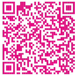
6 Informe fiscal