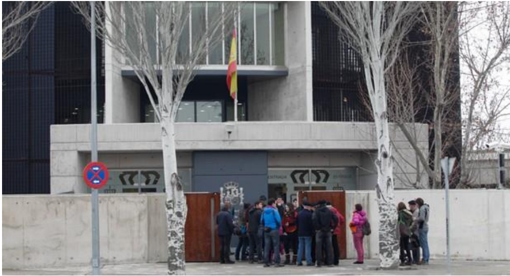
Una de las sedes de la Audiencia Nacional en Madrid.

Tras la recepción por el Gobierno Vasco de la competencia en materia de política penitenciaria se han producido más de 150 progresiones de grado entre las que se encuentran ocho que corresponden a presos y presas de la extinta ETA, disuelta el 4 de mayo de 2018, tras el alto el fuego definitivo anunciado el 20 de octubre de 2011.