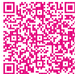
7 permisos auto apelación