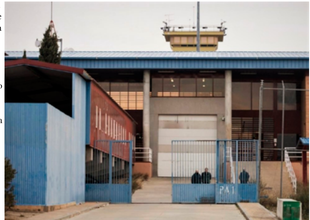
Exterior de la prisión de Zuera.

Se especulaba que las nuevas cárceles de destino no superarían la distancia de 250 kilómetros del País Vasco y en ese mapa se apuntaban diez Centros Penitenciarios: CP Logroño (170km), CP El Dueso-Cantabria (170km), CP Burgos (215km), CP Soria (260km), CP